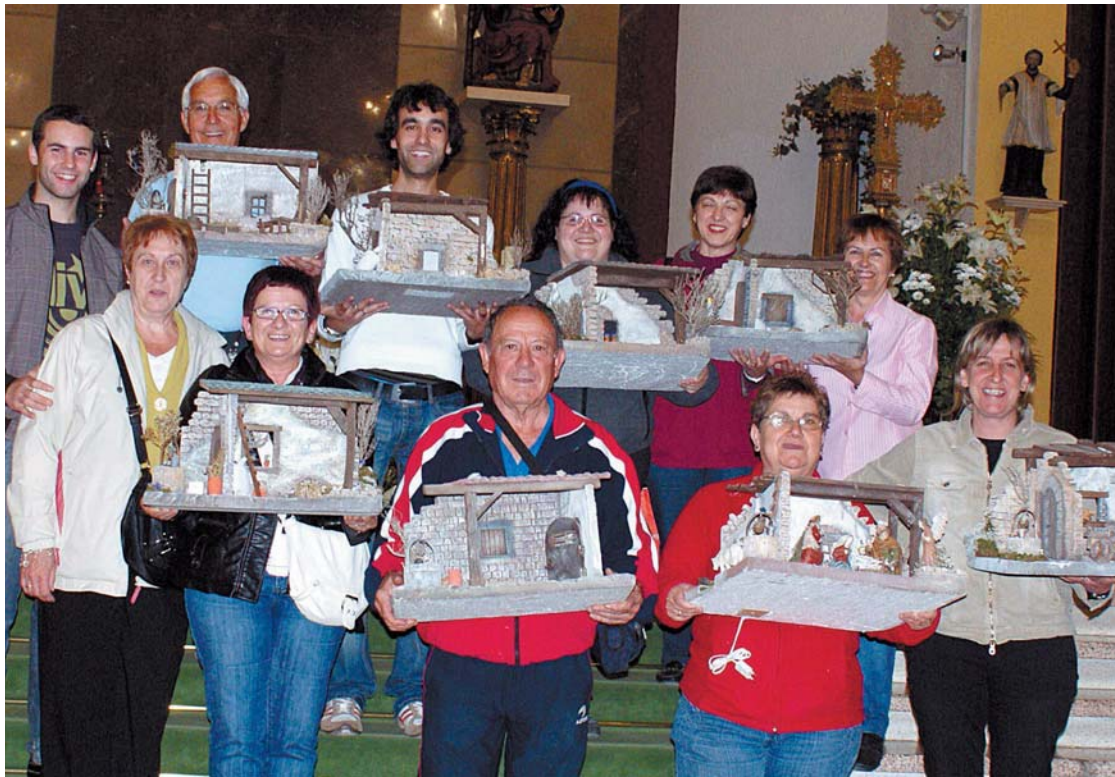
Algunos de los alumnos matriculados posan con sus Belenes finales